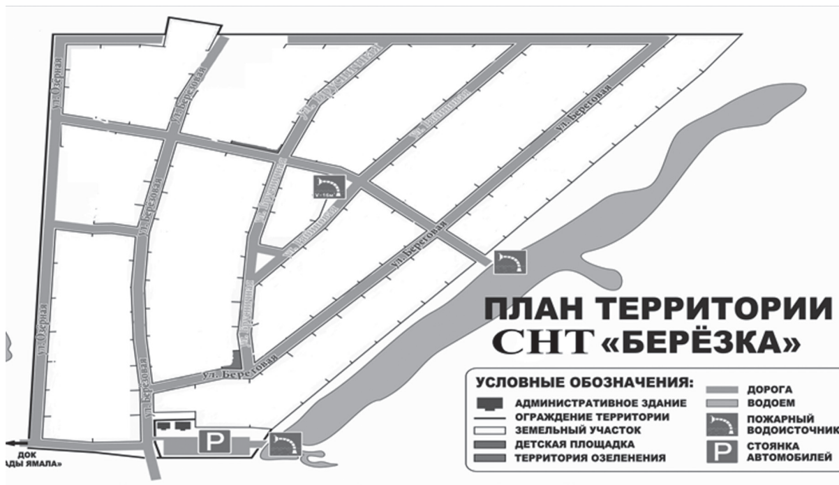
Схема расположения элементов улично-дорожной сети территории садоводческого некоммерческого товарищества «Берёзка», расположенного в границах муниципального образования город Надым

Приложение № 2 к постановлению Администрации муниципального образования Надымский район от 27 апреля 2018 года № 243