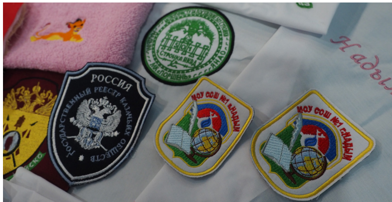
■ Машинная вышивка пользуется спросом у надымчан.