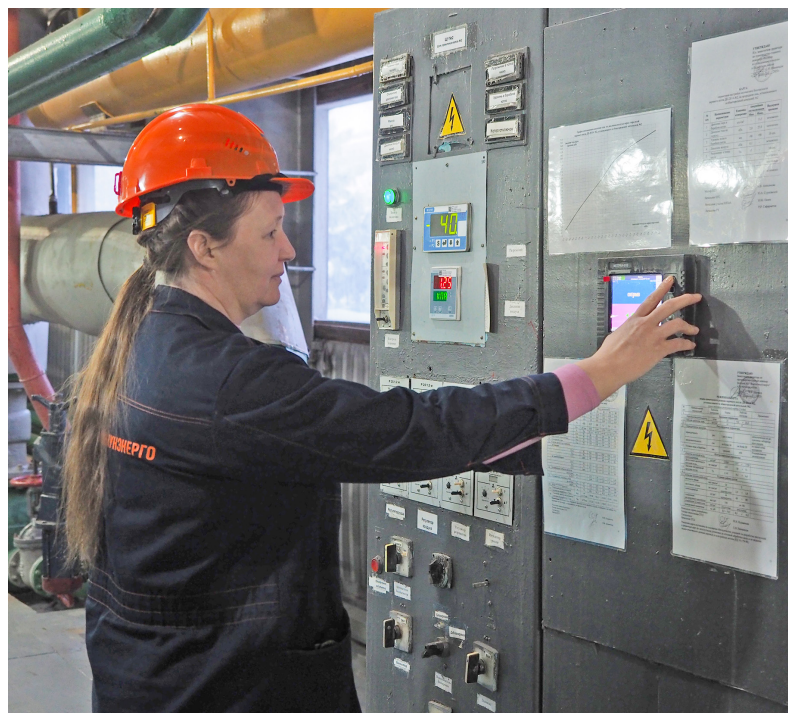
■ В период сильных морозов специалисты «Ямалкоммунэнерго» обеспечивают бесперебойную и безаварийную работу котельных.

— Главным критерием оценки работы филиала является безаварийная работа. В текущем отопительном периоде нештатных ситуаций на