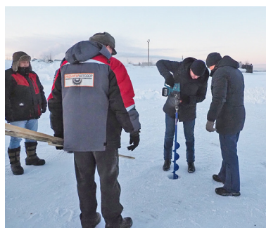
■ Замер толщины льда в месте оборудования купели.