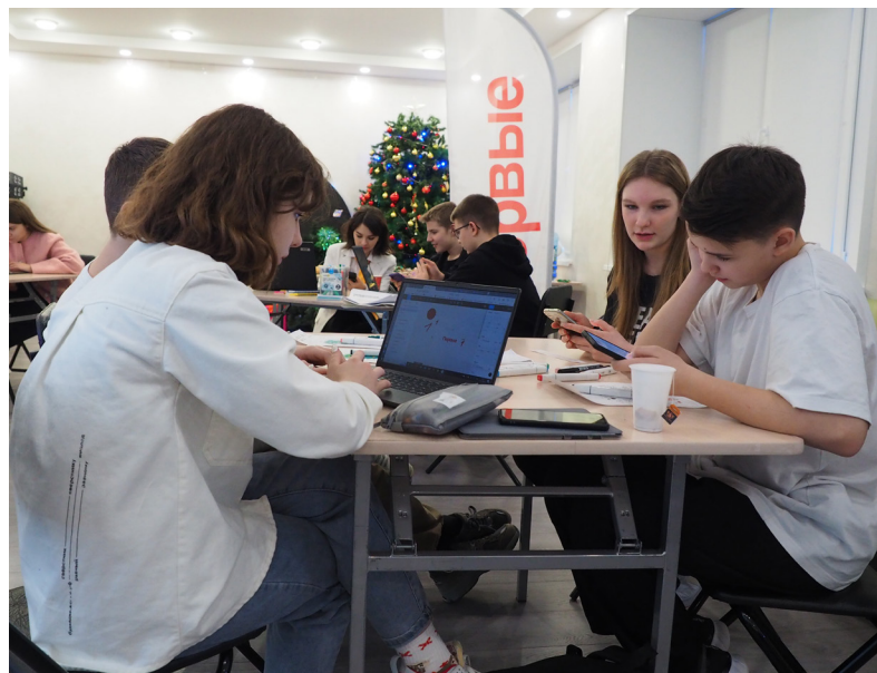
■ Участники медиаинтенсива выполняют очередное задание наставника.

— По итогам двух дней отбору людей в команду, которая в дальнейшем будет развивать телеграм-канал «Движения первых» в Надымском