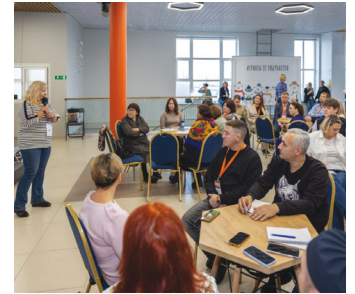
■ Поддержка социально ориентированных НКО в округе проводится на конкурсной основе.

В 2024 году округ получит около 34 миллионов рублей для поддержки социально ориентированных некоммерческих организаций (СОНКО). Это на восемь миллионов рублей больше, чем в предыдущем году.