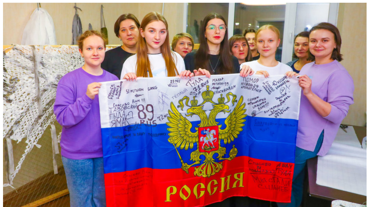
■ Волонтеры штаба «Тихий фронт».

Отдел информационной политики администрации Надымского района.