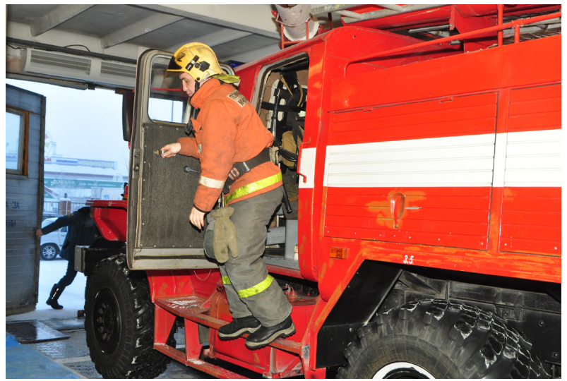
■ Пожарные Надымского района всегда в полной готовности.

Например, отслеживать сроки эксплуатации электрообогревателей: в среднем это 10 лет. Эксплуатируя их после установленного срока, мы подвергаем опасности себя и своё жилище. Также нелишне следить за исправностью электропроводки, розеток, щитков, штепсельных вилок обогревателей. Не включать: электроприборы повреждённые или кустарного производства, одновременно несколько мощных потребителей электроэнергии, не использовать их для суш-