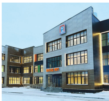
■ Школа «Перспектива» в Новом Уренгое.

Это вторая крупная школа, которая построена в Новом Уренгое. Осе-