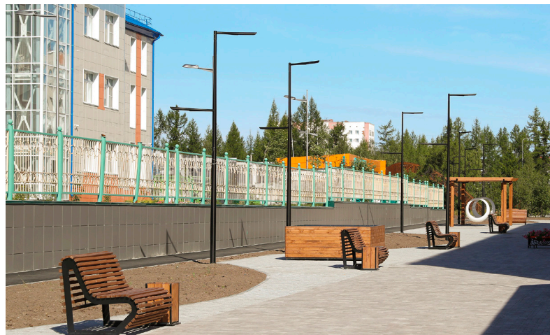
■ Точек притяжения в городах и посёлках округа становится всё больше, что, несомненно, радует ямальцев.

▼ В округе. На Ямале с 2019 года благоустроено более 1 400 территорий