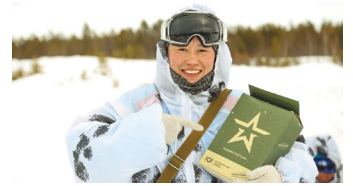
■ Регистрация на курс «Снежные призраки» ведётся до 1 марта 2024 года.

Курс пройдёт с 27 по 31 марта в Ноябрьске. Организует мероприятие Региональный центр патриотического воспитания «Авангард». По итогам участники получат сертификаты о прохождении курса.