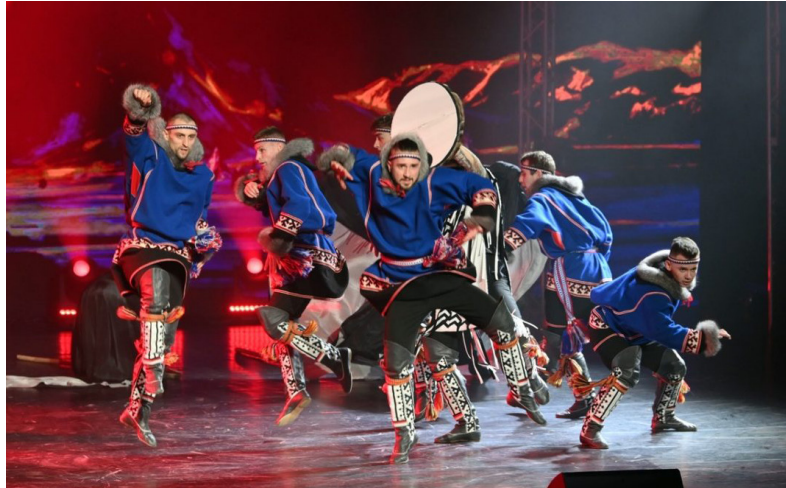
■ Жизнь ямальцев насыщена культурными мероприятиями — фестивалями, концертами, творческими встречами.

Проведение данного конкурса является показателем того, что культурная жизнь Ямала вышла на высокий уровень. В масштабах России появится ещё один конкурс, содействующий зарождению лучших традиций