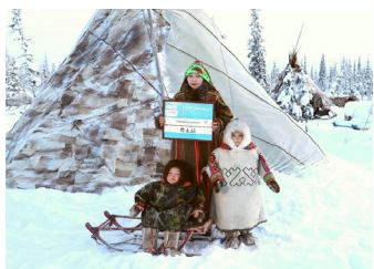
■ ФОТО С САЙТА YANAO.RU

По информации с сайта правительства ЯНАО.