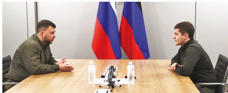
■ Дмитрий Артюхов: «В Волновахе живут родные нам люди, и очень важно, чтобы мы как можно быстрее возвращали им привычный мирный уклад жизни».

В молодёжном центре юные жители Волновахи смогут заниматься в художественной мастерской, медиастудии и студии звукозаписи. Будут созданы киберпространство и молодёжное кафе-библиотека, танцевальный и репетиционный залы, коворкинг. Для самых маленьких – детская игровая зона. Обустраивают многофункциональный зал на 150 посадочных