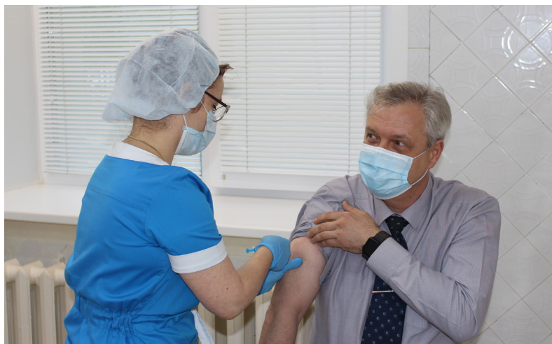
■ Ежегодная вакцинация от гриппа.

Начнём со статистики. За первых две недели 2024 года на территории Надымского района зарегистрировано 882 случая заболеваний ОРВИ. Показатель заболеваемости составил 133,2 на десять тысяч населения. Госпитализированы 29 человек — 3,3% от числа заболевших; в возрастной структуре преобладает заболеваемость среди взрослого населения — 333 заболевших (37,7%), на втором месте дети 7–14 лет — 226 заболевших (25,6%), на третьем дети 3–6 лет — 149 случаев (16,8%).