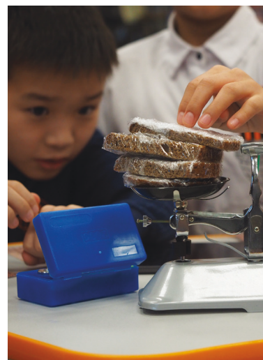
■ Чтобы понять, каков объём 125 грамм современного пшеничного хлеба, школьники использовали механические весы и гири.