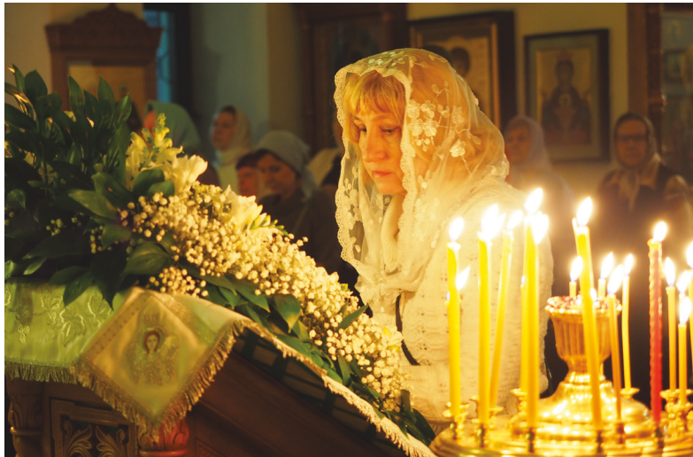
■ Литургия в праздник Крещения Господня объединяет верующих людей для прославления Бога, даёт возможность причаститься Святых Христовых Таин

— Сама суть праздника отражается в названии. Мы именуем его Крещением, но в церковном календаре он звучит как Богоявление. Почему? В этот день Бог явился в наш мир. Родившись в Вифлееме, Христос до 30 лет не был узнаваем обществом именно как мессия, который был обещан. Но начиная с момента, когда он входит в Иордан, всё меняется. На иконах часто изображают момент, описываемый в Евангелии. Когда Иисус выходит из вод, на него нисходит Святой дух и все присутствующие слышат голос Отца, который говорит: «Это сын мой возлюбленный. С ним моё благоволение». Именно с этого момента началось общественное служение Христа как Спасителя и Мессии. Он начал проповедовать и творить чудеса. Также Крещение Господне — это один из двенадцатых праздников, которые связаны с жизнью Иисуса Христа и Богородицы. Как священнику мне радостно, что всё большее количество людей участвует в церковных таинствах.