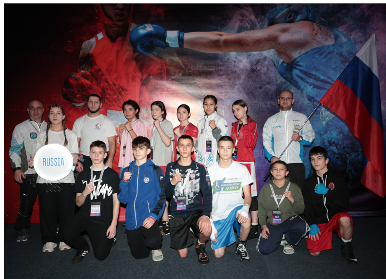
■ На состязания помериться силами с иностранцами помимо надымчан приехали ребята из Нового Уренгоя, Ноябрьска и Муравленко