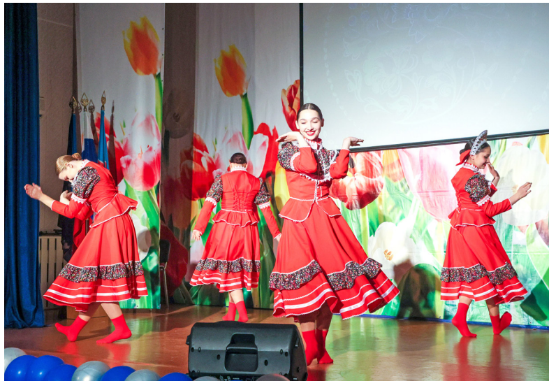
■ Танцевальный коллектив «Полярная мысль» из Центра детского творчества поздравил правохеттинцев с 95-летием Ямала и Надымского района