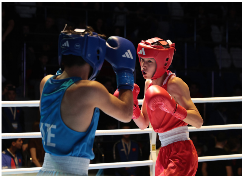
■ Каждый поединок турнира представлял собой отдельный мини-спектакль со своими героями и сценарием. Финал же зависел только от действий самих «актёров»

— У нас было всего три дня на подготовку. Мы до последнего не знали, что приедем сюда. Горжусь ребятами, они проделали большую работу. Спасибо за приглашение, внимание и заботу ко всем участникам.