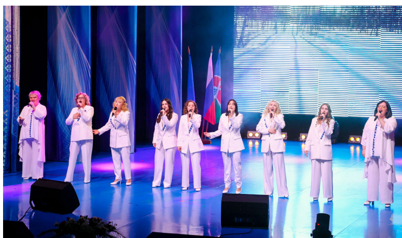
■ Музыкальное поздравление пангодинцев от вокально-эстрадного ансамбля «Коктейль» ДК «Юбилейный»