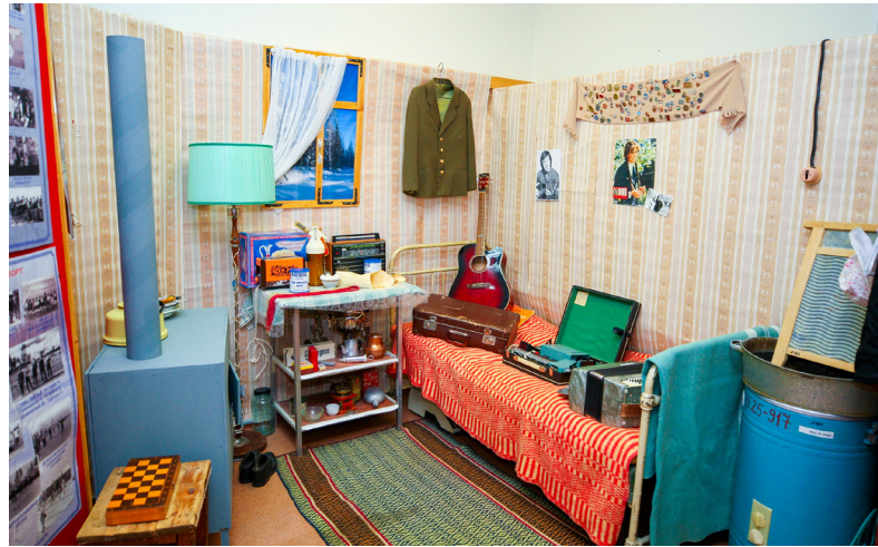
■ Посетив тематическую музейную экспозицию Лонгъюганского ЛПУ, можно ощутить дух становления поселения. ФОТО ЕКАТЕРИНЫ АЛЕКСЕЕВОЙ

Особой гордостью поселения является активная гражданская позиция его жителей. Здесь создан штаб помощи участникам СВО, где два-