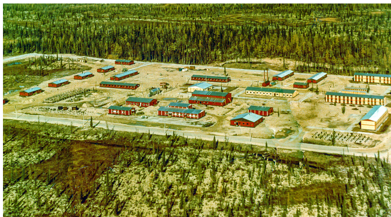
■ Начало строительства посёлка, 1984 год. Первые финские постройки (слева направо): жилые двухквартирные коттеджи по улице Молодёжной, библиотека, амбулатория, клуб Правохеттинского ЛПУМГ, школа, детский сад «Красная шапочка», котельная, общежития и здание ЖЭУ Правохеттинского ЛПУМГ, жилые двухэтажные дома по улице Школьной

Статус посёлка и название Правохеттинский населённый пункт получает 5 ноября 1984 года. Через три года здесь ввели в эксплуатацию среднюю школу на 392 учащихся и детский сад на 100 мест. Ещё через четыре года открыли дом быта, где разместили также почту, авиакасса, телеграф, опорный пункт милиции и управляющую организацию. В следующем году в посёлке открыли музыкальную школу. В 2001 году открыли православный храм «Покрова Пресвятой Богородицы». Первая нитка линейной части газопровода-перемычки на вход КС «Правохеттинская» «СРТО-Торжок» запущена в 2003 году, вторую нитку линейной части газопровода-перемычки на вход КС «Правохеттинская» запустили в 2007 году. В 2010 году введён в эксплуатацию автомобильный мост через реку Правая Хетта, связавший посёлок газотранспортников с посёлками Пангоды, Заполярный и Ямбург, с городом Новый Уренгой и с Большой Землёй. 2023 год ознаменован появлением нового газораспределительного пункта. Такова очень краткая история небольшого, но уютного посёлка. За сухими фактами стоят люди и их самоотверженный труд: это они оздавали здесь предприятия, учреждения соцсферы, строили дома и магазины, работали на производстве в суровых условиях на благо страны. Из обычных будней складывалась их жизнь, образовывались семьи, а сегодня их дети продолжают дело первопроходцев.