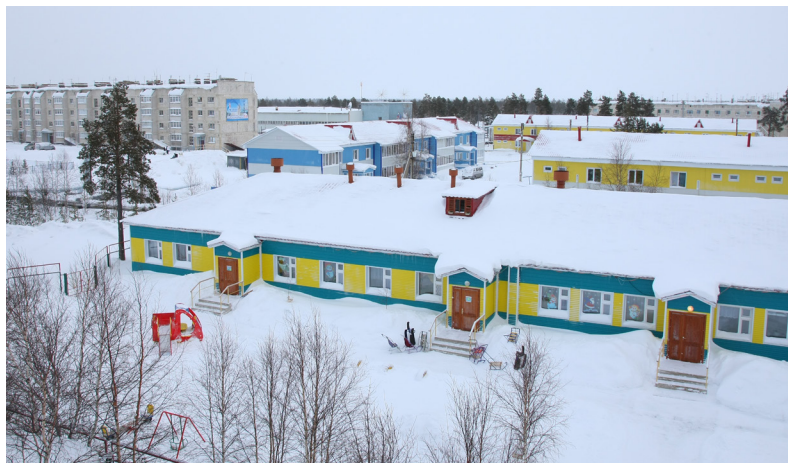
■ С 1972 года стоит посреди северной тайги Лонгьюган. Сейчас в поселении проживает более 1 300 человек.