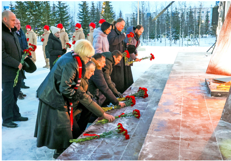
■ Делегация из Надыма вместе с жителями посёлка Пангоды возложила цветы к обновлённому в этом году мемориалу, посвящённому Героям Великой Отечественной войны