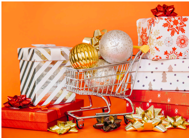
■ ФОТО С САЙТА RU.FREEPIK.COM

Необходимо отметить, что при осуществлении деятельности по продаже товаров вне торговых помещений продавцы должны соблюдать требования, предусмотренные законодательством Российской Федерации о защите прав потребителей, в том числе: законом Российской Федерации от 07.02.1992 г. № 2300-1 «О защите прав потребителей», правилами продажи товаров по договору розничной купли-продажи, утверждёнными постановлением правительства Российской Федерации от 31.12.2020 № 2463, Едиными правилами в области защиты прав потребителей, утверждёнными Декретом Высшего Государственного Совета Союзного государства № 6 от 06.12.2024 г. и другими нормативными актами, регламентирующими правила продажи товаров.