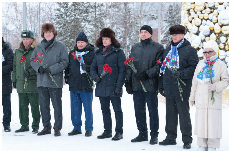
■ Почтить память героев и поблагодарить тех, кто участвовал в освоении Тюменского Севера и трудился во имя процветания Надымского района, Ямала и всей Российской Федерации, – важная составляющая маршрута, который теперь в летописи муниципалитета

— Надымскому району исполняется 95 лет. Я вырос в Надыме. Знаю не понаслышке, как куётся в Арктике сила характера и что такое настоящая взаимовыручка. Надымчане всегда были в числе тех, кто движет наш Ямал вперёд. Хочу выразить искренние слова благодарности всем, кто работает здесь на производстве, в социальной сфере, муниципальной власти и общественных организациях. Спасибо нашим ветеранам, которые заложили этот фундамент! Спасибо молодёжи, которая сегодня создаёт будущее. Особые слова благодарности семьям наших защитников – участников специальной военной операции. Их мужество, стой-