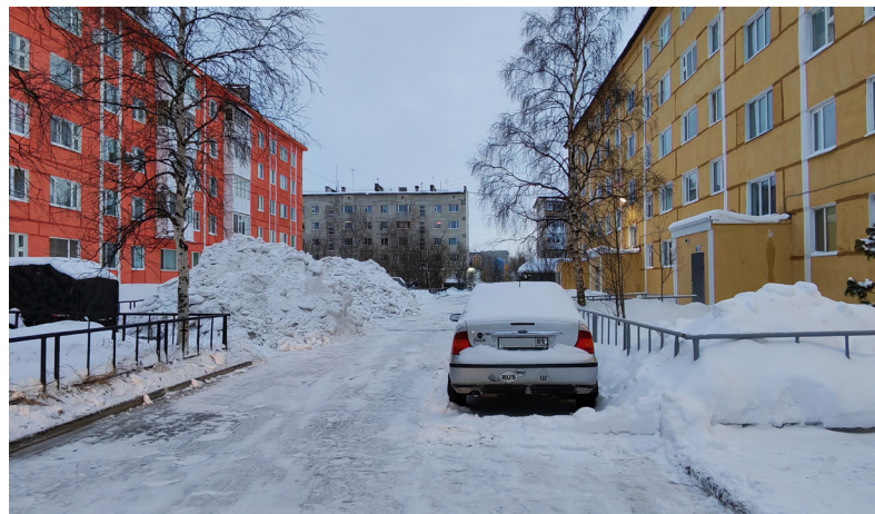
■ Качество уборки снега зависит как от работы дорожников, так и от сознательности надымчан. Свою часть обязанностей первые выполнили, дело за вторыми.

В ходе этого рейда комиссия отметила, что на проверенных территориях работа выполнена добросовестно: дворы расчищены. Жители двух из трёх домов были оповещены с помощью расклеенных объявлений, на подъездах третьего дома объявлений на момент проверки не было, но судя по почти пустой дворовой парковке, автовладельцы тоже были в курсе о планируемой уборке снега. Этот факт доказывает, что система взаимодействия между коммунальными службами и населением может работать эффективно.