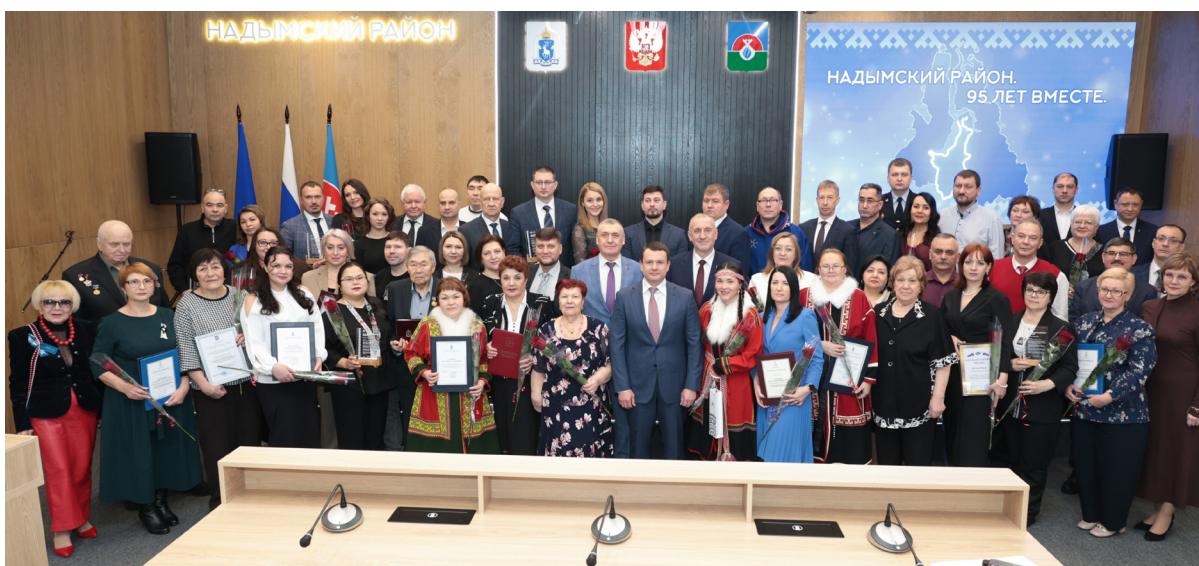
■ На протяжении 95 лет основой развития Надымского района служит гармоничное сочетание богатства природных ресурсов, профессионализма и творческого потенциала людей, сохранение приоритетов и ценностей культуры коренных народов Севера.

▼ Профи. Надымчанам, внёсшим весомый вклад в развитие муниципалитета, вручены награды