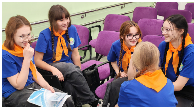
■ На станции «Хиты былых времён» ребята окунулись в мир популярной музыки 80-х, 90-х, 2000-х.