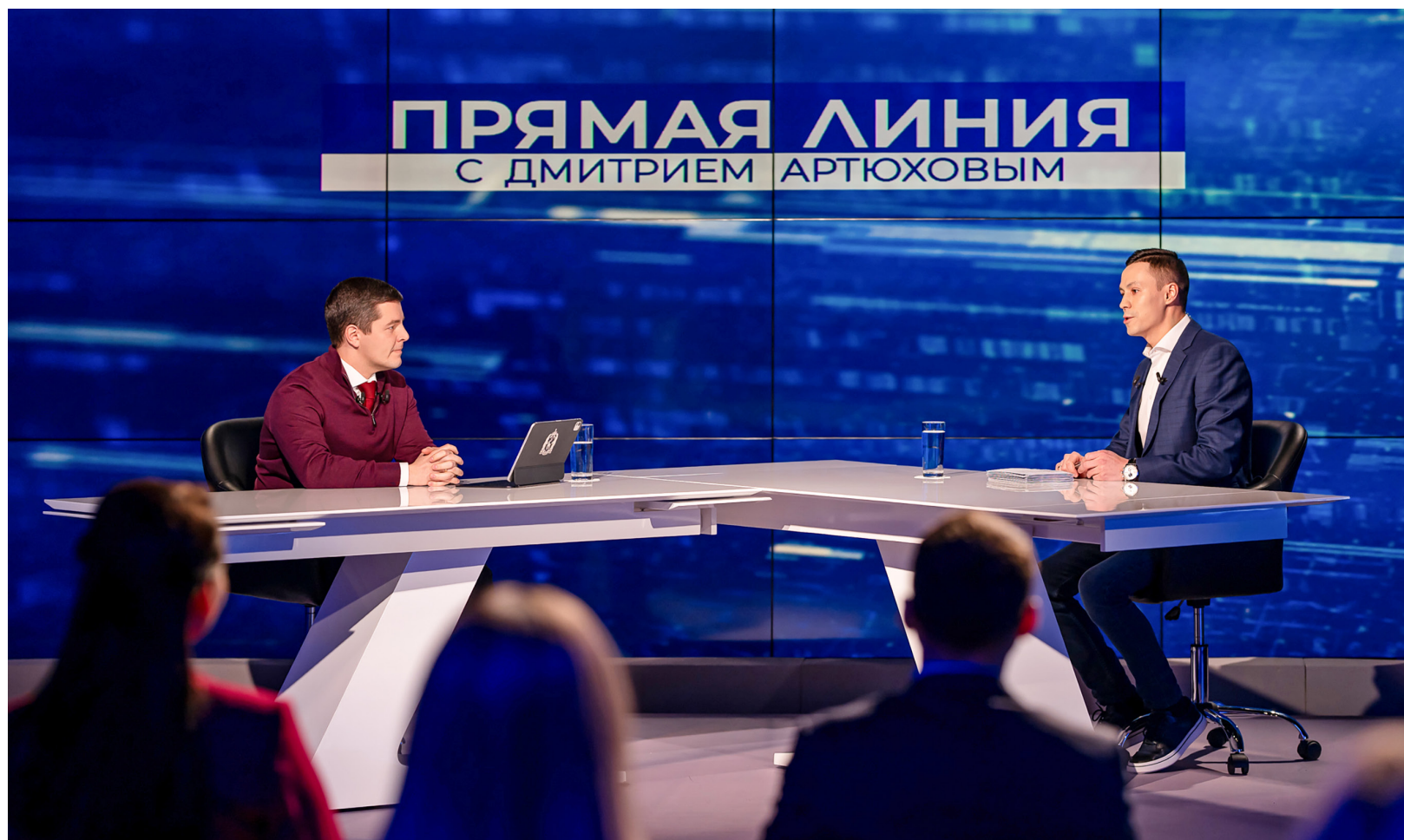
■ За 2 часа 15 минут губернатор Ямала Дмитрий Артюхов ответил на 32 вопроса, а за время прямого эфира северяне задали их более 1 000. Основные темы, волнующие жителей региона, остались традиционными: строительство, ЖКХ, дороги, социальное обслуживание и защита населения.