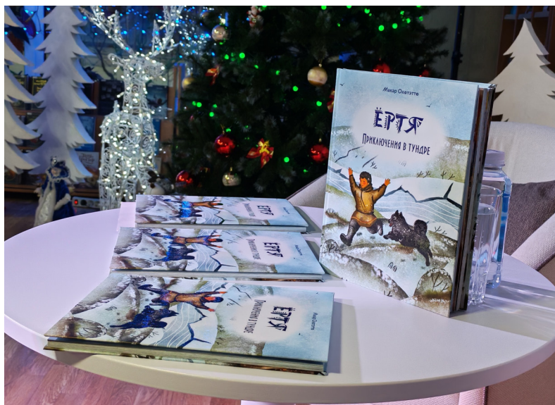
■ По словам автора, книга «Ёртя. Приключения в тундре» в будущем может стать началом целой франшизы, в которую войдут мультфильмы, игрушки и многое другое.