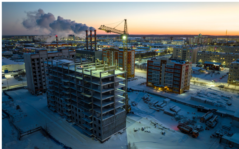
■ Завершить все строительные работы планируется до конца 2026 года.

работников. В помещениях выполнены покрытия полов из ламината, поклеены обои, в санузлах уложена