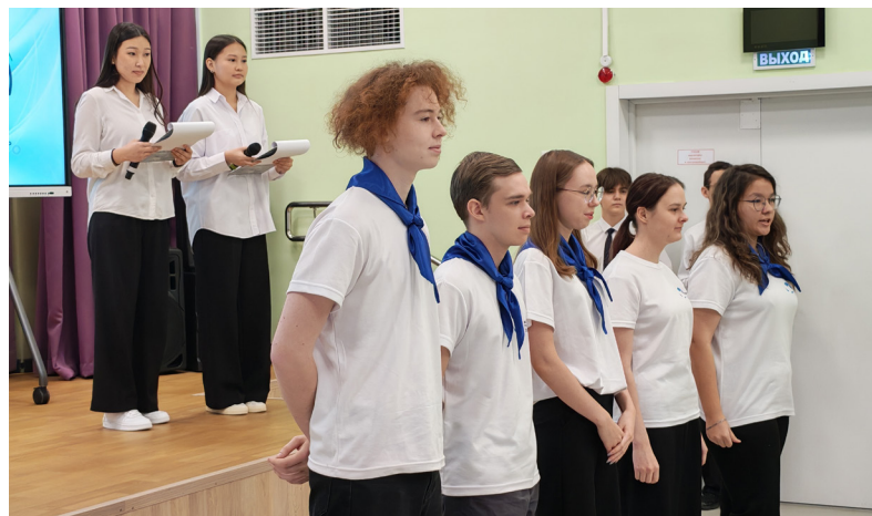
■ На торжественной церемонии открытия слёта команды представили визитные карточки и девиз своего волонтерского объединения

Десятый слёт-фестиваль вновь ярко показал, что волонтерство в Надымском районе — это не просто слово. Это живое, постоянно растущее сообщество активных, чутких и отзывчивых людей, готовых своими руками делать мир вокруг немного лучше, добрее и светлее. И самое важное, что за десять лет это движение не растеряло свой энтузиазм, а лишь набрало силу, вдохновляя молодёжь на новые свершения.