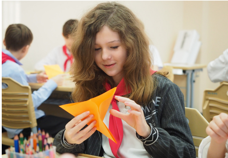
■ Все тюльпаны, которые смастерили ребята, будут возложены к памятной доске воина-интернационалиста — выпускника школы.

На той войне был термин — «чёрный тюльпан». Так солдаты называли самолёты и вертолёты, которые вывозили погибших. «Груз 200» — это код для павших героев, «груз 300» — для раненых. Увидев «чёрный тюльпан», каждый понимал: он летит за нашими ребятами. И вот спустя много лет родилась легенда. Говорят, что на полях Афганистана, где проходили бои, каждой ранней весной расцветают ярко-красные тюльпаны. Местные жители верят, что это цветёт память о советских солдатах. В их честь по всему миру 15 февраля, в день вывода войск из Афганистана, проходит акция «Красный тюльпан». Люди создают алые цветы и возлагают их к памятникам и мемориалам, чтобы никогда не забывать о наших героях.