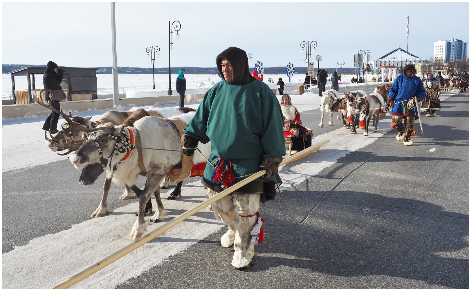
■ Всеми любимым праздником День оленевода позволяет прикоснуться к традициям коренных малочисленных народов Севера, которые они сами бережно хранят и передают из поколения в поколение.