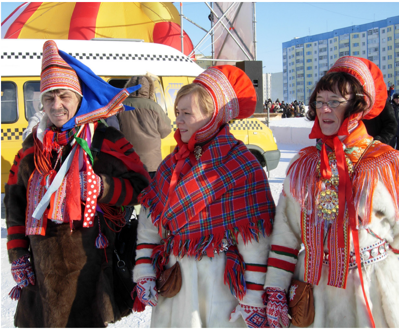
■ Саамские оленеводы — гости праздника оленеводов в Надыме.

мыслов и ремёсел местных и приглашённых с других регионов предпринимателей. Надымчанами и гостями праздника охотно раскупается деликатесная оленина и северная рыба.