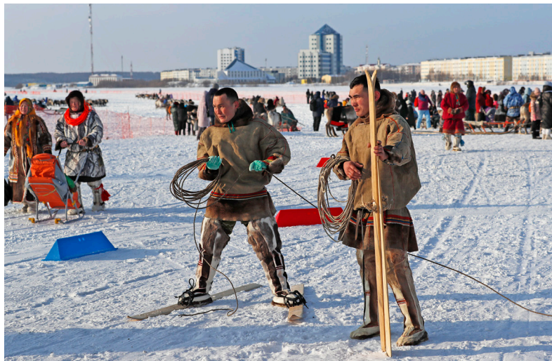
■ Два года назад появился новый вид соревнований – этнобиатлон, и он уже успел привлечь к себе интерес зрителей и завоевать уважение спортсменов.