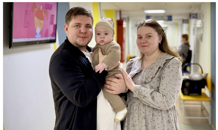
■ Документ выдаётся парам при заключении брака, даже если регистрация прошла за пределами округа.

По информации с сайта правительства ЯНАО.