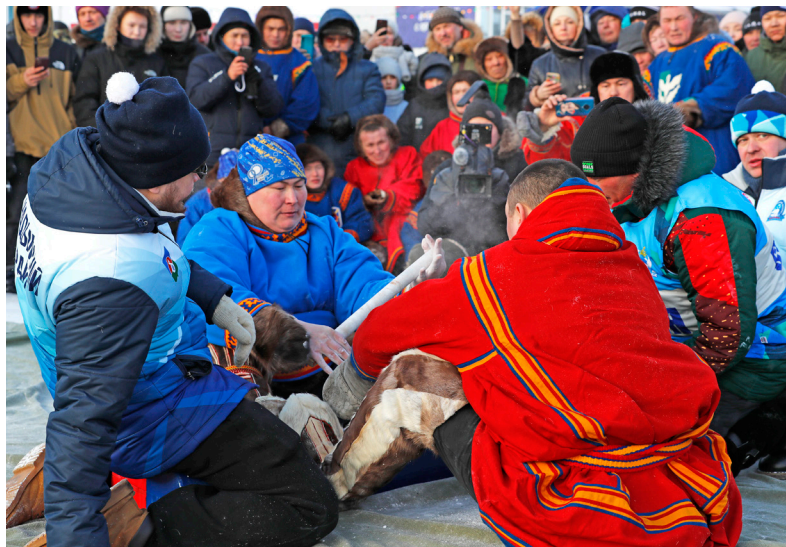
■ Один из самых зрелищных и популярных видов соревнований – перетягивание палки: здесь всегда много болельщиков