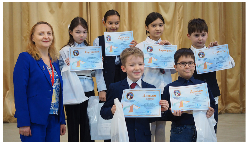
■ Ребята, отмеченные в секции «Физика, математика и техника». Это направление требует не только глубоких знаний в исследуемой теме, но зачастую и настоящего инженерного склада ума.

Севера, теме — применению роботов в сельском хозяйстве.