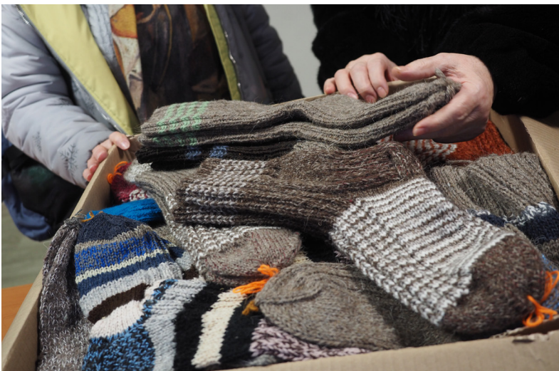
■ Мастерицы отмечают, что каждое изделие создаётся с мыслью о тех, кому сейчас особенно важны поддержка и тепло.

Как отмечают вязальщицы, присоединиться к деятельности объединения горожанам можно и даже нужно. Они будут рады видеть в своих рядах новые лица и пары рук. Место и время встречи: в Центральной библиотеке каждую среду в 16 часов.