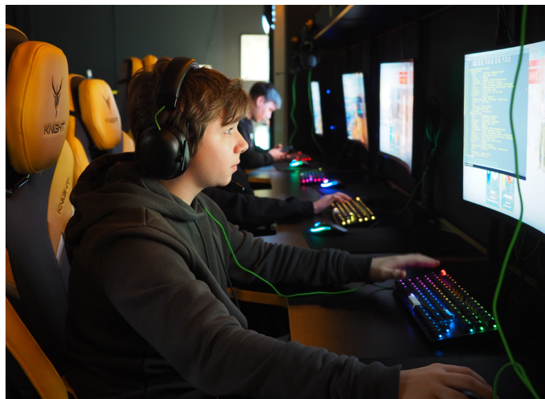
■ Спорт нового тысячелетия — это не бездумное кликанье компьютерной мышью. Он развивает реакцию, умение работать в команде и тактическое мышление.