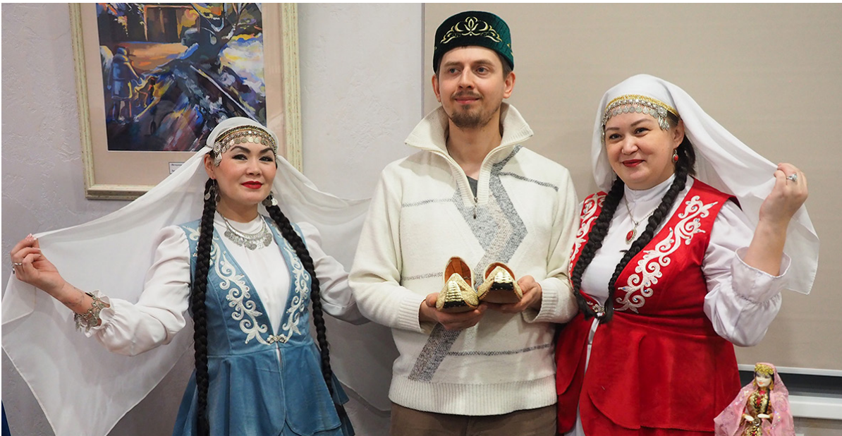
■ Фестиваль «Этноград» стал для надымчан хорошей возможностью прикоснуться к культуре народов России. Игра на музыкальных инструментах, песни, танцы, одежда, предметы домашнего быта — всё это формирует у человека представление о многовековых традициях нашей многонациональной Родины.

▼ Культура. Жители Надымского района прикоснулись к обычаям и традициям народов России