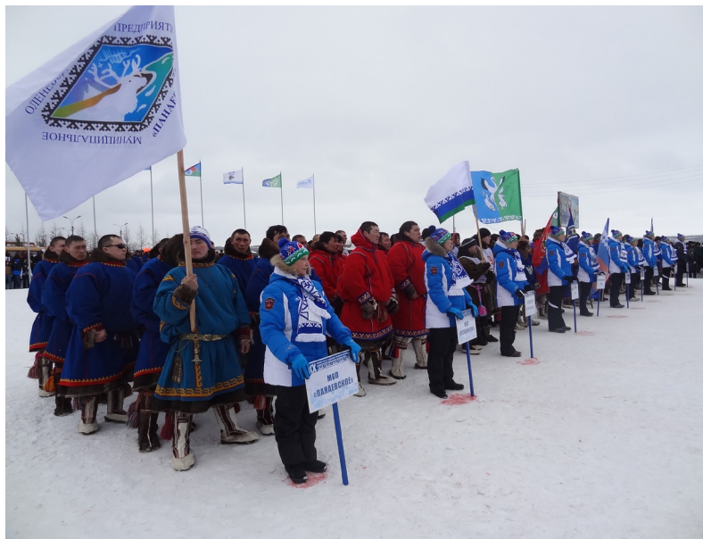
■ Построение команд-участниц на торжественном открытии соревнований оленеводов

В связи с тем, что соревнования оленеводов в Надыме стали самыми зрелищными, а также прочно вошли в число мероприятий окружного значения, в 2003 году администрация Надымского района об-