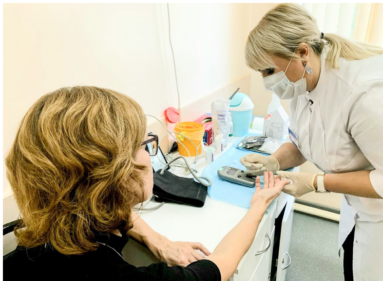
■ Необходимо систематически контролировать артериальное давление, а также проверять уровень холестерина и сахара в крови.

Забота о сердце начинается с внимательного отношения к себе. Контролируйте показатели здоровья и проходите медосмотры, чтобы сохранить активность и хорошее самочувствие.