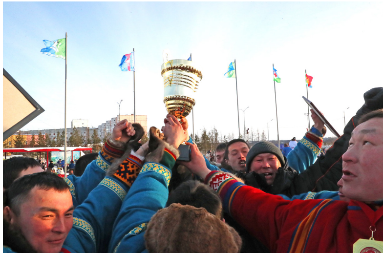
■ Как красиво сияет в лучах закатного солнца Кубок губернатора ЯНАО: чтобы плучить право поднять его над головой, необходимо приложить много усилий.

— Как правило, те судьи, у которых есть опыт работы на соревнованиях, продолжают свою работу в том же виде спорта на очередных состязаниях. Они знают все правила и ню-