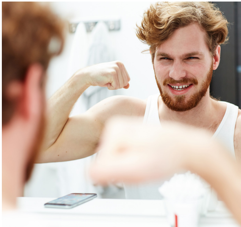
■ Регулярные профилактические обследования помогают выявить риски на ранней стадии, экономят время и деньги на лечение в будущем. Не откладывайте заботу о себе — запишитесь на чек-ап уже сегодня.

В прошлом году такое обследование на Ямале прошли более 60 тысяч северян, а за январь этого года — уже 5 тысяч человек, из них половина муж-