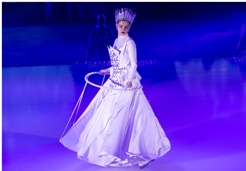
■ В ледовом дворце спорта «Надым» выступления артистов сопровождалось творческими номерами театра «Воскресенье».

ти и внуки продолжают жить на Ямале. И сегодняшний праздник — это настоящий образец межнационального баланса и согласия. Конечно, такой масштаб невозможен без поддержки наших ключевых компаний. Общества «Газпром», «Газпромнефть», «Новатэк», «Роснефть» — они понимают: реализовывать важнейшие нефтегазовые проекты нужно в балансе и гармонии с нашей землёй. Это вопросы экологии и, конечно, сохранения традиций. И когда есть такая спонсорская и организаторская поддержка, это очень значимо. Этот год объявлен нашим президентом Годом народно-