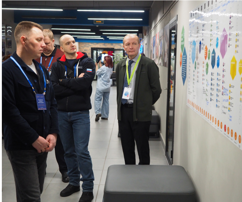
■ Участники выездного совета глав посетили школу № 3. Для гостей провели экскурсию, в ходе которой сотрудники и ученики учреждения рассказали об особенностях организации старшей школы и реализации проекта «Будущее Надыма».

— Это поселение с преимущественно деревянным жилищным фондом. При этом там долгое время полностью отсутствовала автозаправочная станция. Ближайшая точка, где можно было купить топливо, находилась либо в 80 километрах по зимнику, либо в 5 километрах, но только в летний период и только по воде. Ситуация была критической с точки зрения безопасности: жители вынуждены были запасаться бензином впрок, канистры с топливом хранились в подвёздах, гаражах, а иногда и просто возле домов. Тогда мы вышли на предпринимателя — инициатора проекта. Наша задача заключалась в помощи с административной частью. В максимально короткие сроки мы сформировали и предоставили ему земельный участок в аренду, помогли с логистикой, оформлением документов и согласованиями. Предприниматель, в свою очередь, закупил оборудование для современной роботизированной заправки. Учитывая отсутствие сотовой связи в Ныде, он также установил роутер, обеспечивающий передачу