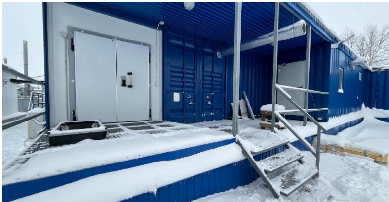
■ Предприятие «Северянка» использует для производства местную рыбу: пелядь, сига, щёкура, щуку, а также выращивает собственную форель.

Запуск нового цеха стимулирует развитие местной переработки на Ямале. Это позволяет разнообразить ассортимент рыбной продукции в магазинах округа. Сегодня в реестре переработчиков сельхозпродукции региона значатся 14 предприятий. По итогам 2025 года они произвели почти три тысячи тонн рыбной продукции — от мороженой до готовых блюд.