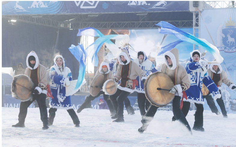
■ Старт празднику дал миф. Танцевально-театральная постановка рассказала о «Хранителе всех легенд» — духе Севера, чьё дыхание становится северным сиянием, а сердце — вожаком оленьих стад. С его пробуждения начинаются состязания оленеводов.

Погружение в атмосферу искусства начиналось ещё до старта дейст-