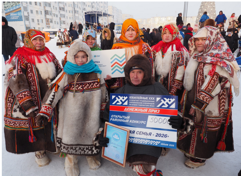
■ Большая и дружная семья Талигиных. В конкурсе они представили традиции и культуру шурышкарских ханты

говорили и на родном, и на русском языках.