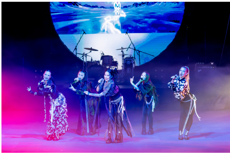
■ В этом году культура коренных малочисленных народов была представлена во всей полноте: от традиционных песен и мотивов до синтеза с современными жанрами и направлениями. Одним из самых необычных и ожидаемых среди молодёжи стало выступление ненецкой кейпоп-группы НОМАНУ.