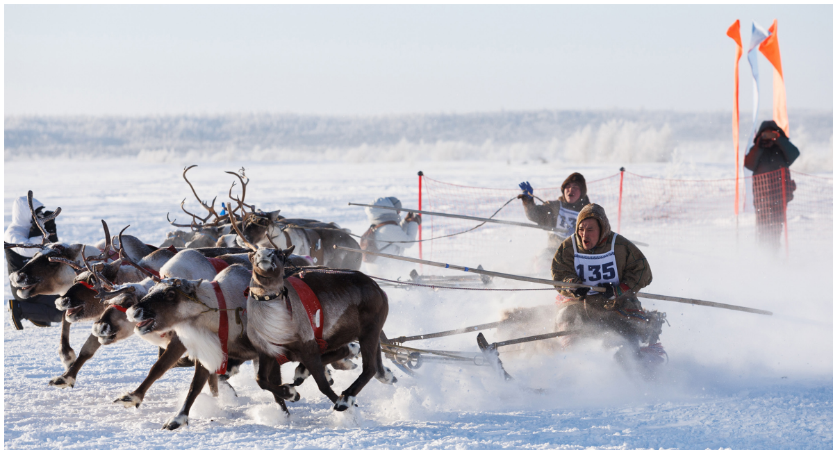
■ По накалу страстей и престижу северные гонки ни в чём не уступают Формуле-1.

▼ Нани торова! В тридцатый раз Надым собрал лучших атлетов из числа коренных малочисленных народов Крайнего Севера