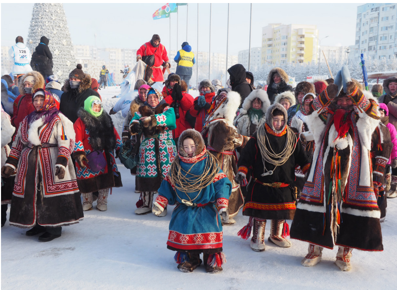
■ Конкурс всегда привлекает внимание зрителей. Состязание среди семей, ведущих кочевой и полукочевой образ жизни, позволяет хоть ненадолго прикоснуться к культуре и традициям коренных малочисленных народов Севера

Неважно, какое место заняли участники. Важно то, что все они яркие, уникальные и интересные, ценят и берегут наследие предков. А ещё безоговорочно любят свои родные края и общий для всех дом — прекрасный Ямал.