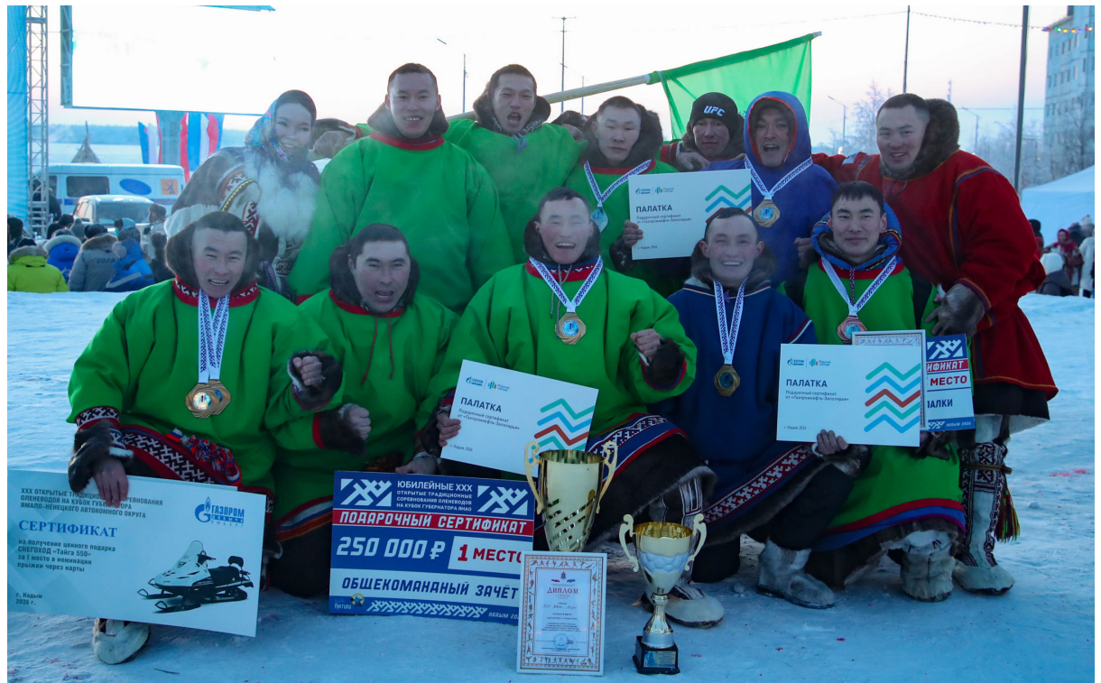
■ Обладатели юбилейного кубка — команда ТСО КМНС «Харп» из Ямальского района.

По информации с сайта правительства ЯНАО.