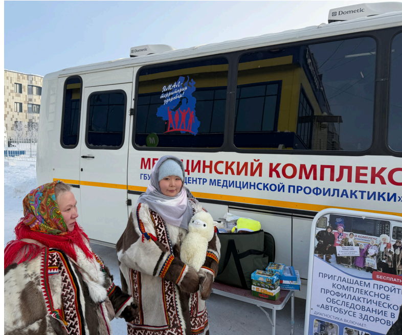
■ Посещение «Автобуса здоровья» для многих коренных жителей Ямала уже стало обязательной частью программы Дня оленевода.

Уже семнадцать лет надымские медицинские работники и профилактиологи в дни традиционных соревнований оленеводов на Кубок губернатора ЯНАО приезжают к месту их проведения, чтобы надымчане, гости города из национальных посёлков и тундровики смогли проверить своё здоровье. Для них важно, чтобы обратившиеся к ним за консультацией